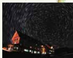
しらびそ高原「天の川」は天体観察としても有名